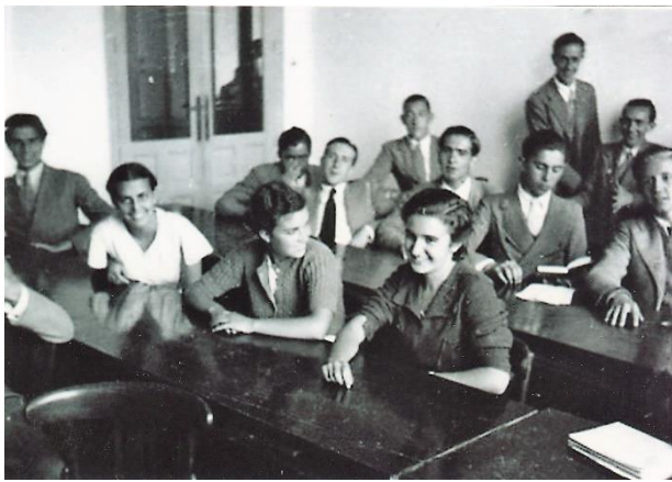
Alumnos del Instituto-Escuela en clase.

El Instituto-Escuela basó su sistema de enseñanza en la experiencia educativa de la Institución Libre de Enseñanza (ILE) y en las corrientes pedagógicas europeas más avanzadas de su tiempo. Contó con un plan de estudios propio que aumentó las horas lectivas de cada materia, redujo el número de alumnos por clase, combinó los aprendizajes en el aula con las prácticas en los laboratorios, reforzó la enseñanza de los idiomas, prestó una gran atención a la formación estética, musical y deportiva de los alumnos, implantó la evaluación continua y fomentó el uso de la biblioteca. También contempló un amplio repertorio de actividades, como las visitas a museos y fábricas, las excursiones por España y el extranjero, y los intercambios con alumnos de otros centros europeos. El experimento del Instituto-Escuela se truncó en 1936, con el estallido de la Guerra Civil.